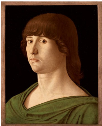
Giovanni Bellini, Ritratto di giovane