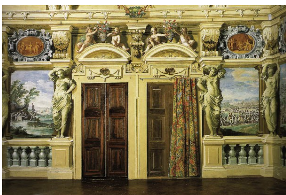
Palazzo ducale di Sassuolo