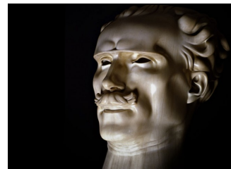
Il maestro Arturo Toscanini (1925)

Dopo la mostra antologica di Forlì del 2012 e quella al Musée d'Orsay di Parigi della scorsa primavera, finalmente anche Milano, sua città natale, rende omaggio a Adolfo Wildt (1868-1931) nell'ambito della serie di mostre sulla scultura organizzate dalla GAM.