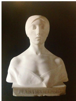
La martire (1895)

Quota di partecipazione: €18,00 Si prega di consegnare la quota di partecipazione in busta chiusa con il proprio nome.