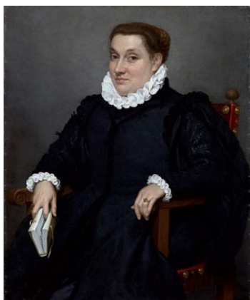
Giovan Battista Moroni Ritratto di gentildonna con libro