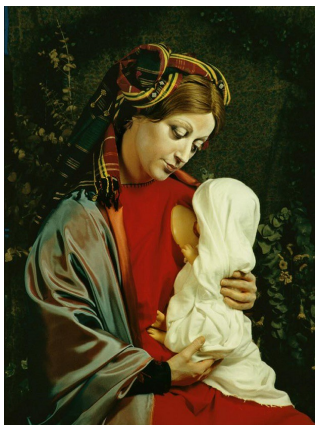
Cindy Sherman, Untitled #223

La mostra "La grande madre" è la galleria viva di un secolo in movimento, di una cultura in evoluzione, sempre in bilico fra tradizione ed emancipazione, dove la donna è protagonista assoluta.