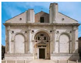
Leon Battista Alberti, Tempio Malatestiano , 1450 ca, Rimini.