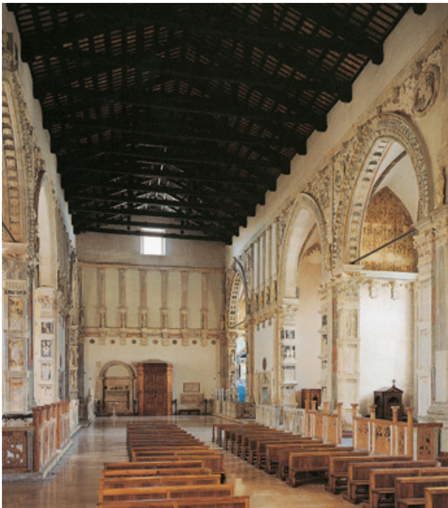
15.4 Leon Battista Alberti, Tempio Malatestiano, ca 1450, Rimini. Veduta dell'interno.