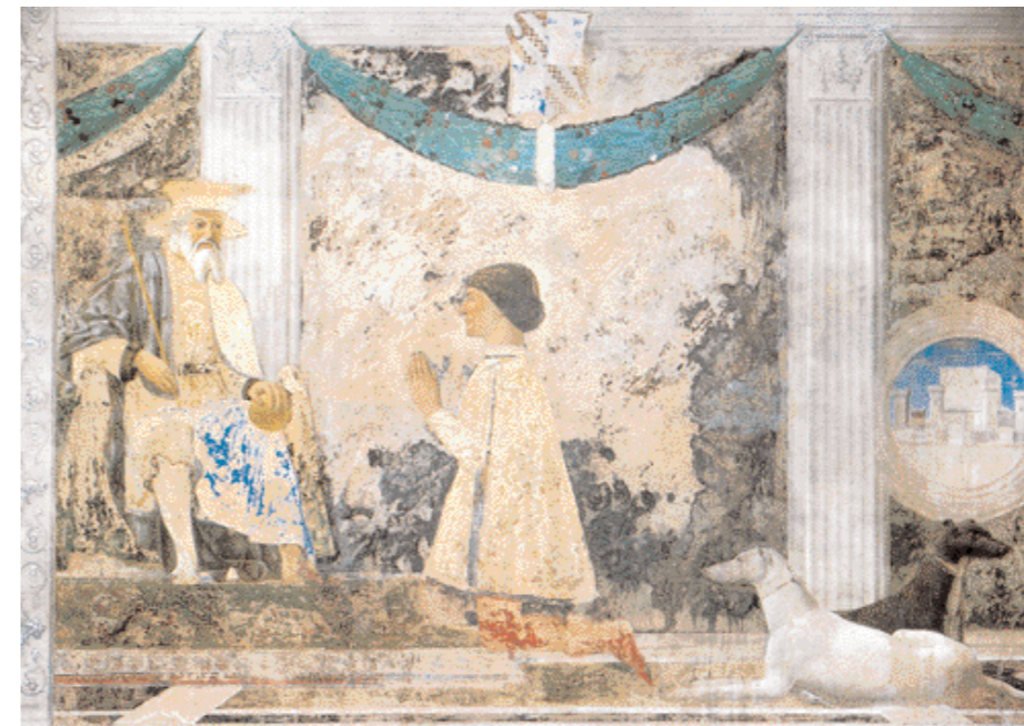
2. Piero della Francesca, Sigismondo Pandolfo Malatesta in preghiera davanti a san Sigismondo , 1451, affresco staccato, 257 x 345 cm, Rimini, Tempio Malatestiano, cappella delle Reliquie.

da Piero della Francesca (fig. 2): la figura del santo, cui il principe rende omaggio, ha le fattezze dell'imperatore Sigismondo, mentre l'oculo sulla destra con la veduta di Castel Sismondo allude simbolicamente alla forza militare dello stato.