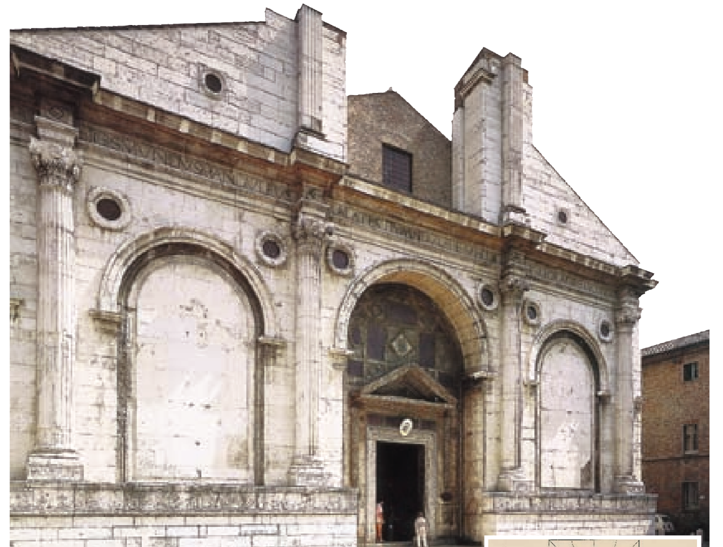
1. Leon Battista Alberti, Tempio Malatestiano a Rimini.

Pregno di significati laici e politici appare anche lo straordinario affresco realizzato